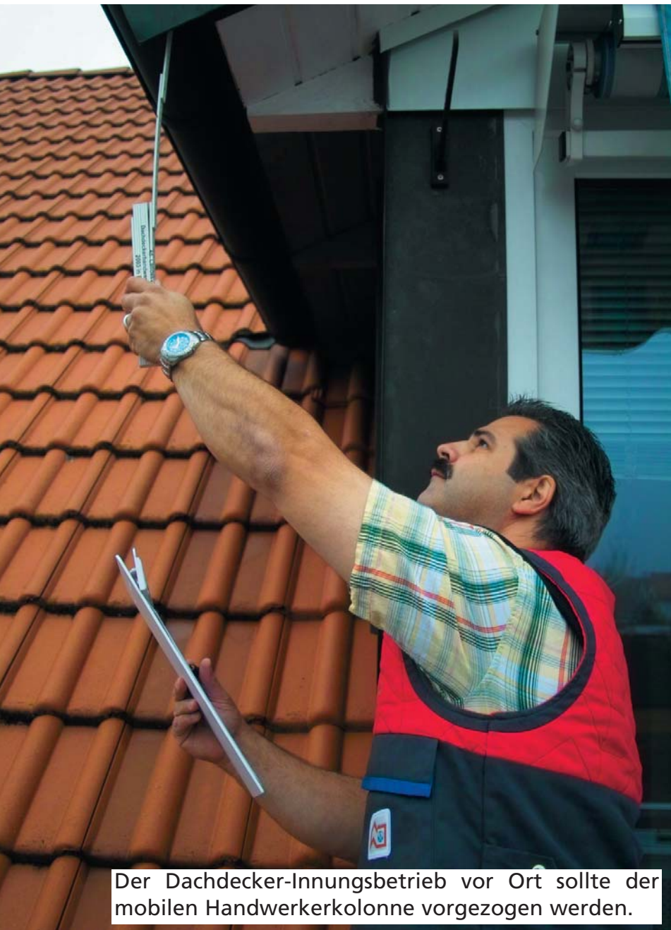
Der Dachdecker-Innungsbetrieb vor Ort sollte der mobilen Handwerkerkolonne vorgezogen werden.

Der Dachdecker in der Nähe bietet dem Auftraggeber viele Vorteile